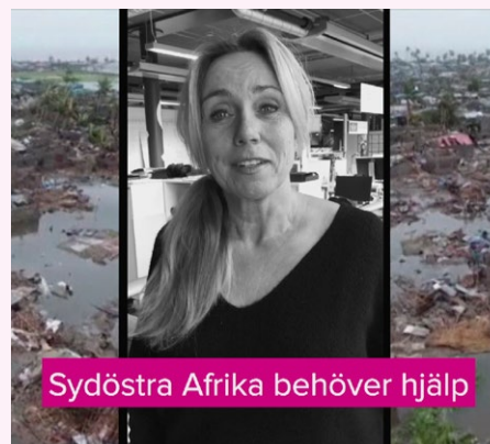
När cyklonen Idai slog till mot sydöstra Afrika var Radiohjälpen snabbt ute med en appell för att samla in medel till de som drabbats.