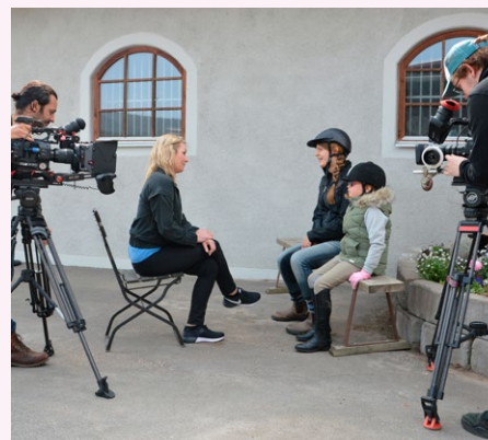
Inspelning på Stockholms Handikappridklubb.