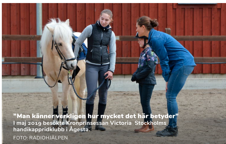
"Man känner verkligen hur mycket det här betyder" I maj 2019 besökte Kronprinsessan Victoria Stockholms handikappridklubb i Ägesta.